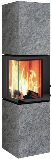
GRIGIO CHIASSO natura