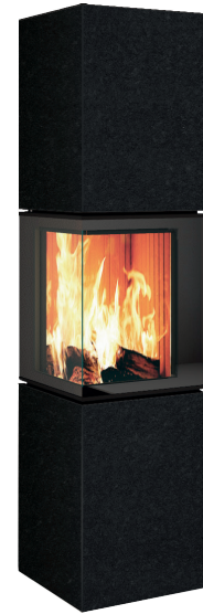
NERO TORTONA natura