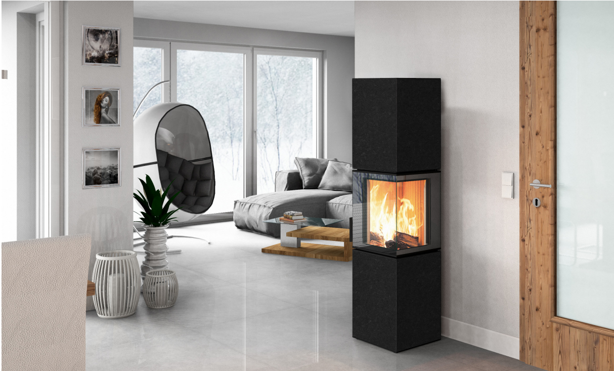
K20XL Nero Tortona