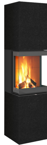
NERO TORTONA natura