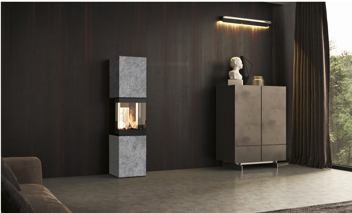
K30XL Grigio Chiasso