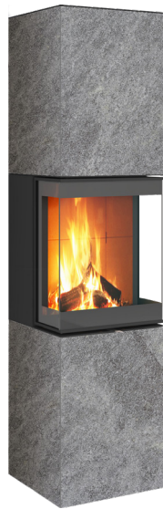
GRIGIO CHIASSO natura