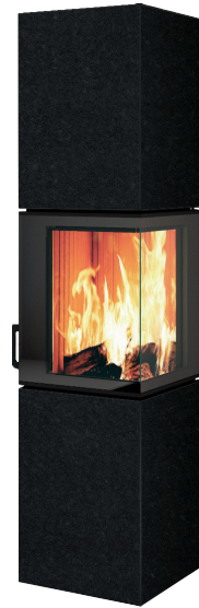
NERO TORTONA natura