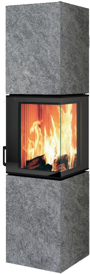
GRIGIO CHIASSO natura